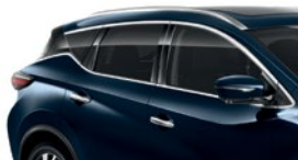
Темно-синий — RBG