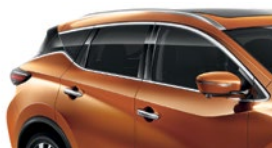
Оранжевый — EAW